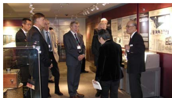
写真 2：電気の史料館見学