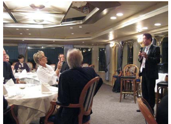
写真 7：11/18 フェアウェルパーティー